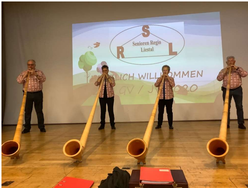
Die Alhorngruppe Enzian spielen zu Ehren der Jubilare auf.